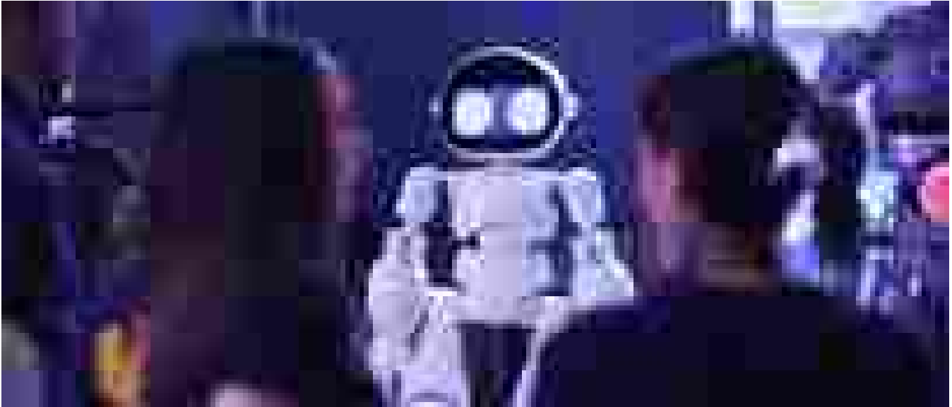
Meta al lavoro sui robot umanoidi per uso domestico