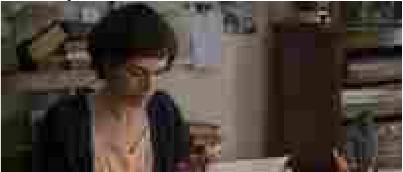
Miriam Leone, la mia Oriana libera e coraggiosa

Ritaglio stampa ad uso esclusivo del destinatario, non riproducibile.