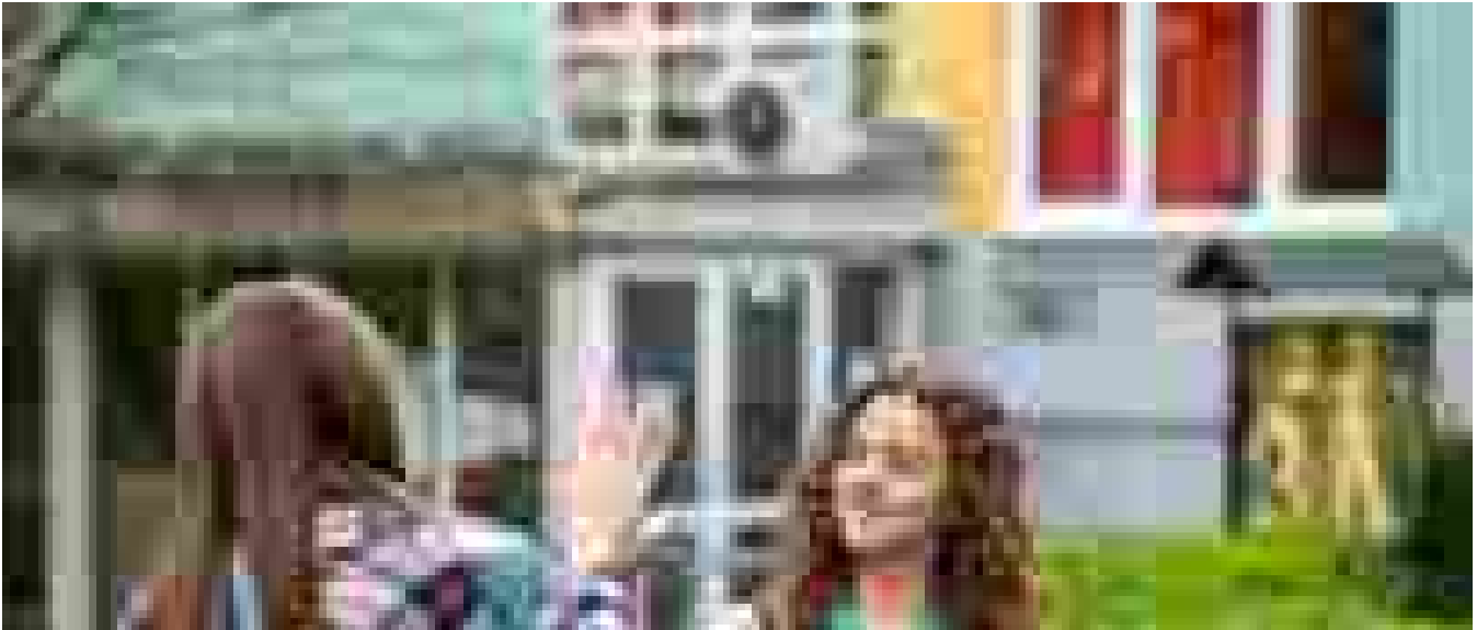
Cosa fare da grandi? 6 studenti su 10 hanno già le idee chiare