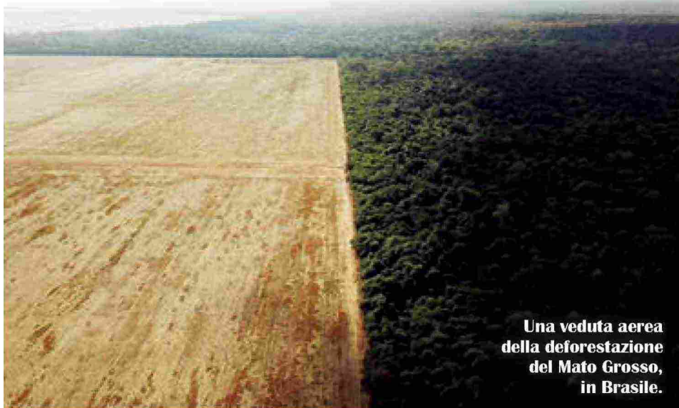
Una veduta aerea della deforestazione del Mato Grosso, in Brasile.

→ perde il controllo delle cose che fa, non riesce più a dominare il suo istinto. Dobbiamo, invece, trovare un limite anche dentro di noi. D'altra parte il peccato originale nasce proprio dal superamento di un limite».