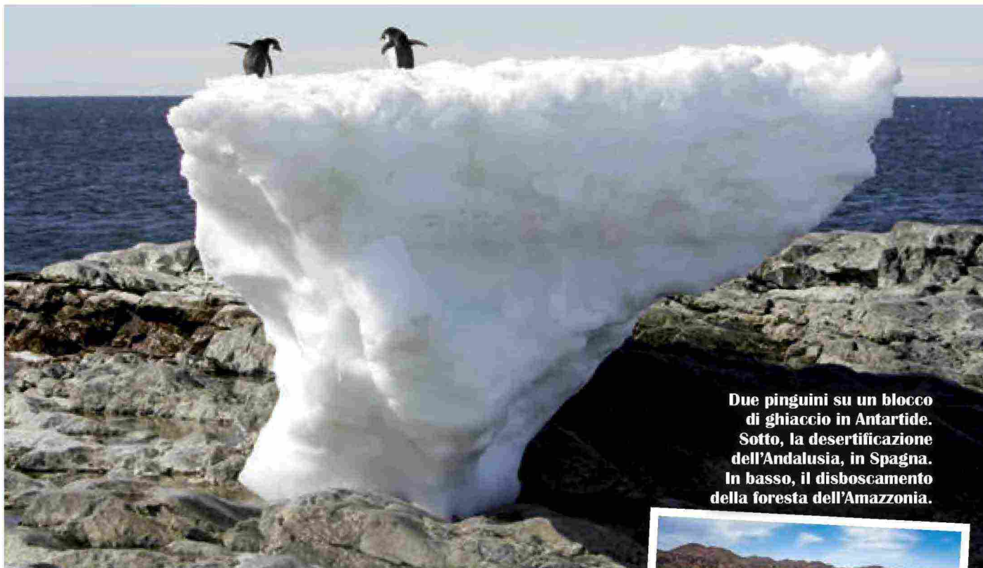
Due pinguini su un blocco di ghiaccio in Antartide. Sotto, la desertificazione dell'Andalusia, in Spagna. In basso, il disboscamento della foresta dell'Amazzonia.

pire meglio l'ambiente ci porta anche a un'antropologia più sofferente».