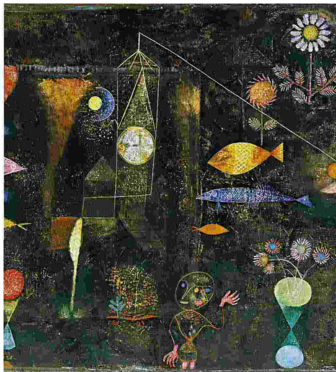
Paul Klee, «Fish magic» (1925)

C'è una lunga tradizione per cui anche la parola scritta dialoga, risponde, è «speculum animi» dell'autore e a sua volta diventa uno specchio per noi che leggiamo