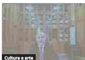
Cultura e arte

SECONDA EDIZIONE DEL PREMIO LETTERARIO ASSOSINDERESI AWARDS