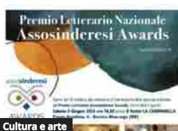
Cultura e arte