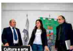
Cultura e arte