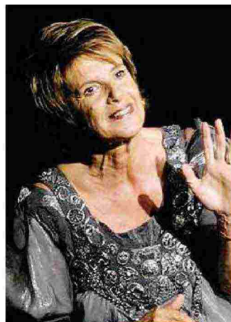
Lella Costa sarà in scena il 23 maggio