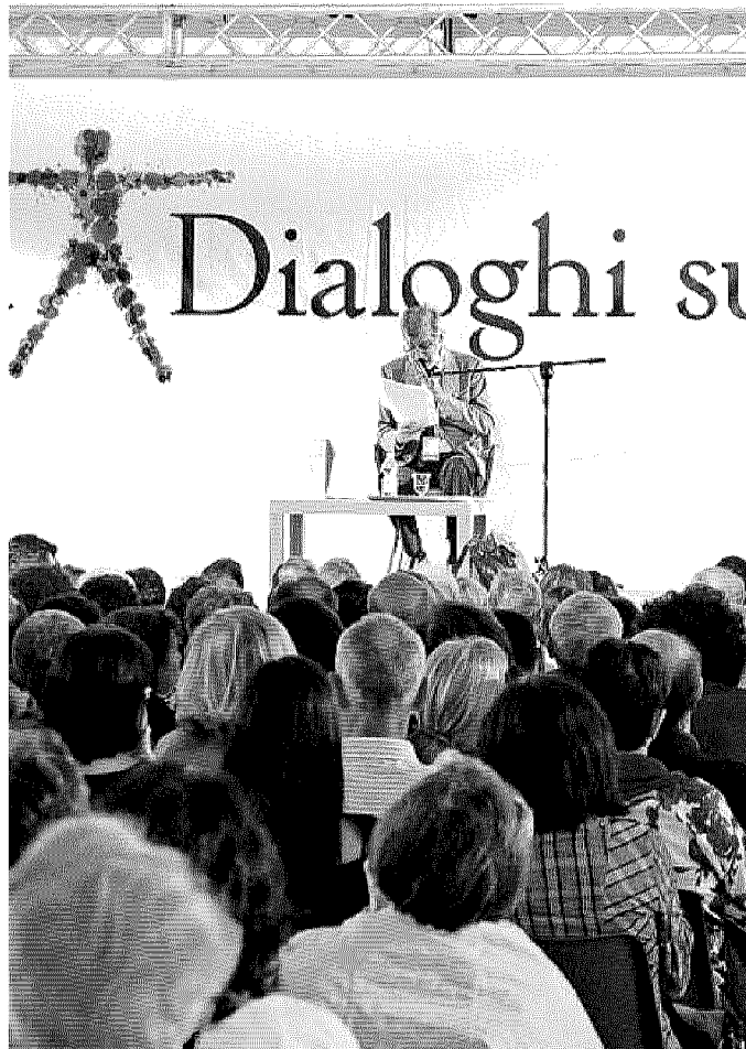
Un incontro di Dialoghi sull'uomo di una precedente edizione