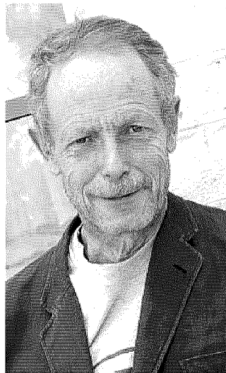
Erri De Luca, scrittore