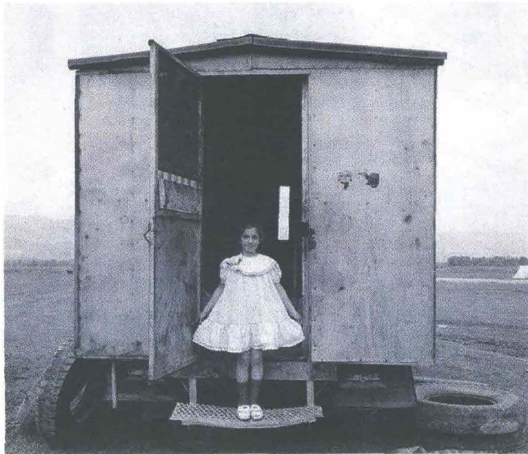
"Turkey - Central Anatolia" di Nikos Economopoulos, 1988 ©Magnum Photos. In alto l'autoritratto di Ferdinando Scianna

Da oggi a domenica Pistoia va in scena "Dialoghi sull'uomo" , festival di antropologia del contemporaneo ( www.dialoghisulluomo.it ). Incontri, dialoghi, letture, spettacoli, proiezioni e passeggiate. Il tema di quest'anno è «Le case dell'uomo. Abitare il mondo». Tra i partecipanti l'antropologo Francesco Remotti, il calciatore Lilian Thuram, Ferdinando Scianna, Vinicio Capossela.