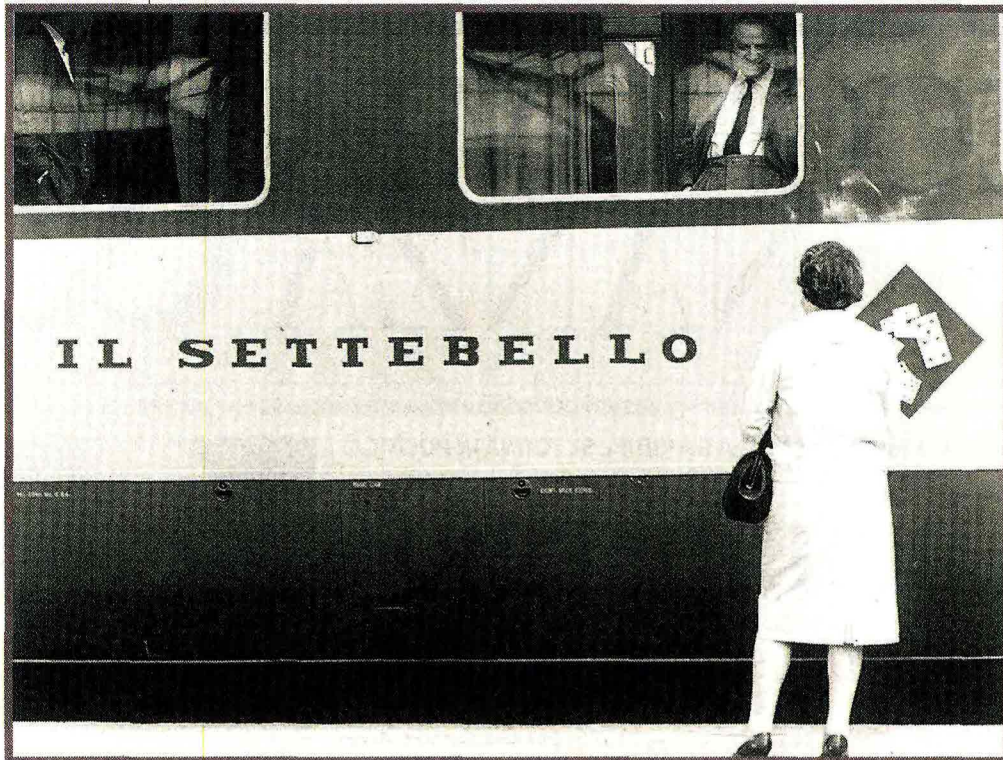
In treno Partenza del Settebello dalla Stazione Centrale di Milano. L'ETR 300 Settebello è stato il primo treno ad alta velocità delle FS, 1963

L'evento Alla IV edizione di «Dialoghi sull'uomo» s'inaugura venerdì 24 maggio alle 16.30 nel Palazzo Comunale di Pistoia la mostra fotografica «Italiani viaggiatori. Un secolo di vacanze e viaggi nelle fotografie storiche dell'Archivio Touring Club Italiano». La mostra è aperta sino al 7 luglio, ingresso gratuito. Sab. e festivi ore 10-18. www.dialoghisulluomo.it