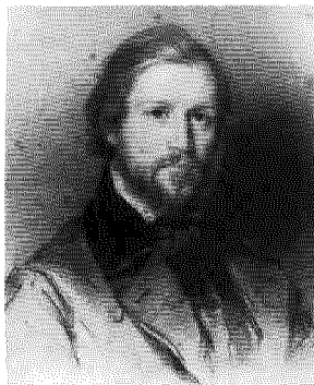
Ch. Valentin Alkan sini.